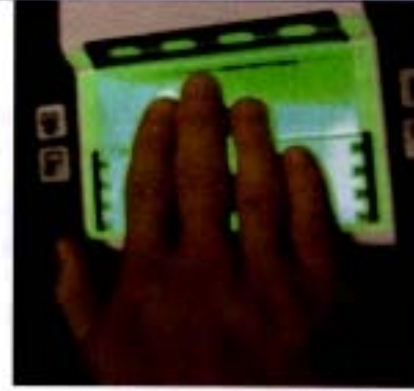
2. Adım / Step 2

Place right hand fingers on green square as shown.