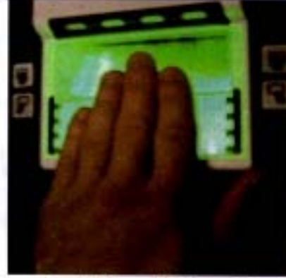
1. Adım / Step 1

Place left hand fingers on green square as shown.