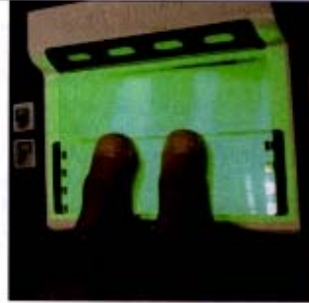
3. Adım / Step 3

Place thumbs together on green square as shown.